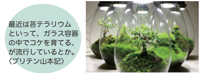
最近では苔テラリウム といって、ガラス容器 の中でコケを育てる、 が流行しているとか。 (ブリテン山本記)

遠くから見るもの、近づかなければ見えないもの、体験しなければわからないもの、この一年そんな思いとポケ防止策に探求に励みたいと思います。