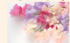
1月の花 スイートピー

スイートピーの花言葉は、「門出」や「優しい思い出」「別離」「ほのかな喜び」などです