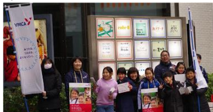
よろしくお願ひしま〜す。

日本 YMCA 同盟を通じて、全世界の恵まれない子どもたちに寄付をしています。それで救われた子どもたちがいたことは間違いないと思いますが、どこにどれだけ寄付したか知りませんでした。特に疑問にも思わなかったのですが、今年は具体的にインドのチェンナイ、セントボニファスアンバハムという孤児院に直接寄付するという目的がはっきりとした募金活動になりました。