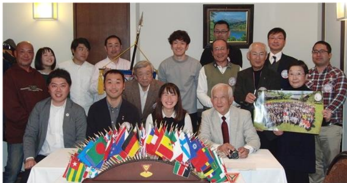
ゲストが7人、ありがとうございました。中央のレモンがかわいいです。