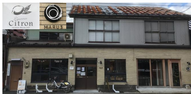
小型商業施設十三日(とみか)と店のエンブレムです。

継いで作られたのが小型商業施設「十三日(とみか)」です。飲食店やシェアオフィスの他に、皆様に使っていただける余白のあるギャラリーやフリースペースもあります。どうぞ、一度言ってみてください。