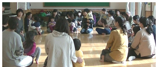
《指導者講習会》11月20日(水)・21日(木) 楽しく新しい発見や学びがあった濃い2日 間でした！ ありがとうございます。 帰ってからもワクワクが止まらず、なかなか寝付けませんでした(笑)