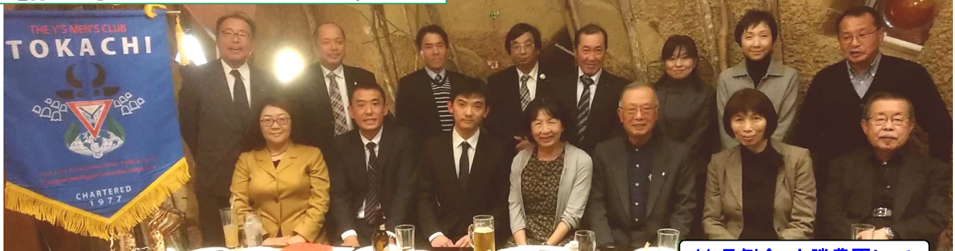
11月例会 十勝農園にて