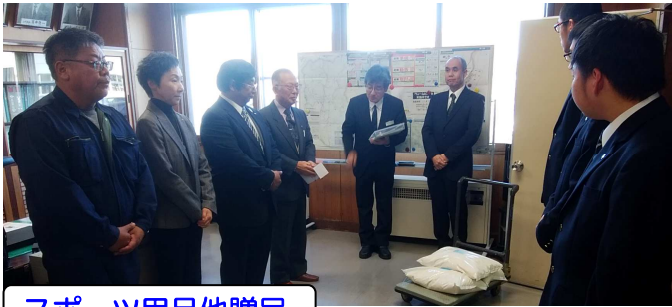
スポーツ用品他贈呈