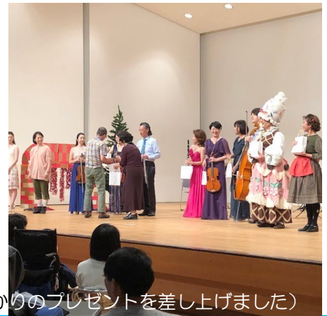
(演奏者には心ばかりのプレゼントを差し上げました)