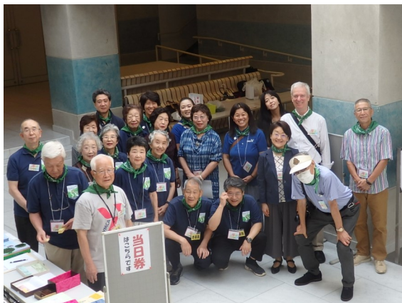
開会式に参加した ボランティアの皆さん。