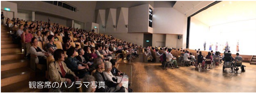
観客席のパノラマ写真