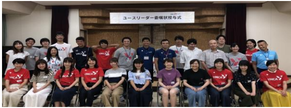
ユースリーダー委嘱状授与式

皆様から支援をいただき、ユースボランティア・リーダーズフォーラムと全国YMCAリーダー研修会に参加をさせていただいています。バザーやチャリティーラン、クリスマス会などでも大活躍のリーダーたち、YMCAだけではなく社会を元気づける存在として、今後も活躍に期待しています。