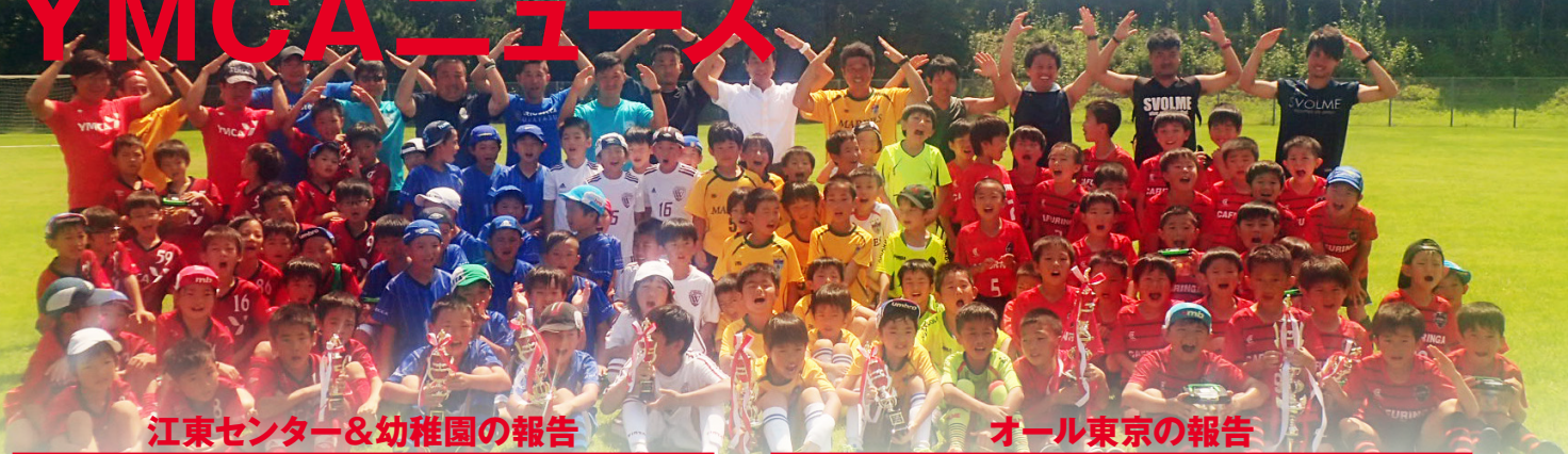
江東センター&幼稚園の報告