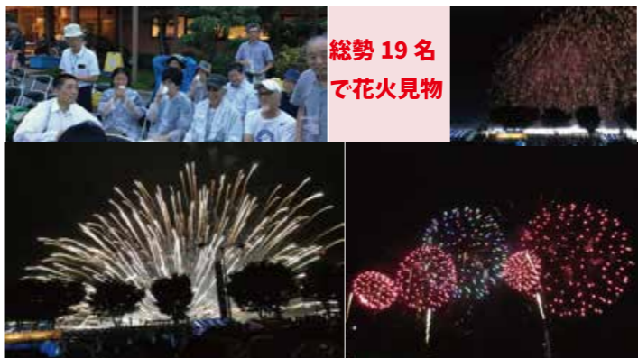
総勢19名で花火見物