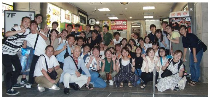
楽しかった、打ち上げパーティ、お店の前で全員集合