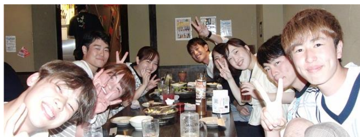
カメラが向くと、お決まりカメラ目線。この乗りがいいんだよな。