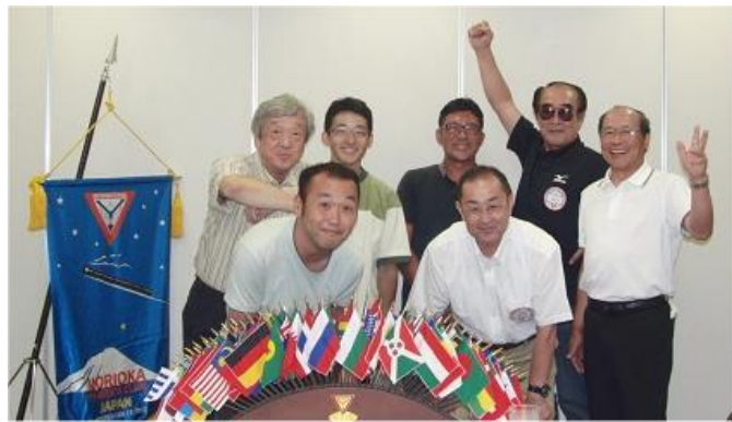
納涼例会集合写真、長岡メンものもらいで目を隠しています。

これからの行事が目白押しですので、今日は明日に向かっての充電の意味合い。大関さん、エネルギーは満タンになりましたか？もうすぐ夏が終わります、もりおかワイズも盛岡 YMCA も一気に走り抜けましょう。あっという間に楽しい時間は過ぎ去り、夜は更けていきました。