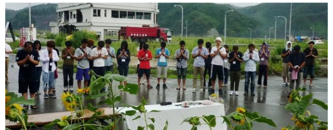
ここは、大槌町役場跡地、犠牲者に合掌