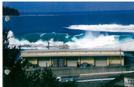
重茂の津波、マリンブルーです。

わかしお石鹸しか使用していない岩手県宮古市重茂地区、(おもえ)は35年前から、海と川を守ろうと、合成洗剤を追放して