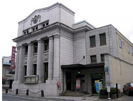
重厚な花崗岩でできた建物です。

盛岡市中の橋通りにある、盛岡信用金庫本店。重厚な花崗岩で造られた建物です。観光スポットとして道路の斜め向かいにある旧岩手銀行な中の橋支店の赤レンガ館が有名です。しかし、