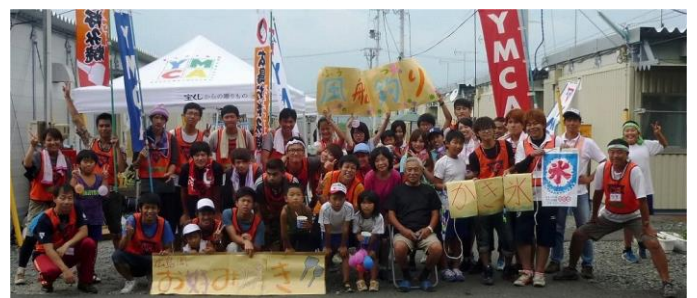
やったあ、充実感と感動で疲労も心地いいです。