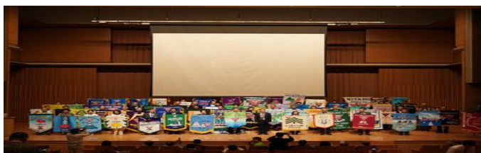
バナーセレモニー