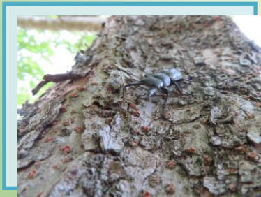
わくわくヴィレッジに早くも現れた「コクワガタ」

冒頭で申し上げた通り、関東地方も間もなく梅雨入りするものと思われます。雨が降ることで、お客様のキャンプファイヤーなどの野外プログラムが中止にならないよう祈るとともに、空は暗くともスタッフは明るい表情でお客様をお迎えするよう心掛けて参りたいと思います。