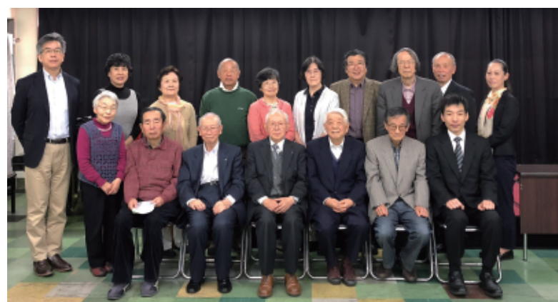
●5月1日朝7時半 早天祈禱会に集まった方々

そんなことに思いを馳せながら、毎年この創立記念日にこの山梨の地にYMCAがあることを喜び賛美する祈禱会が開催されています。今年も17人のYMCAをこよなく愛する有志の皆様にお集まりいただくことが叶いました。残念ながら今年はお席できませんでしたが、当時を知る人々の貴重な話を聞くことも楽しみの一つとなる会です。とりわけ今年は今会館での最後の機会となりました。来年はいよいよ新会館となり、翌2021年には創立75周年の記念の式典となります。皆様、ぜひこの創立記念日を覚えて大勢ご出席いただき、共に祈り、これからのYMCAの在り方についてご指導いただければ幸いです。