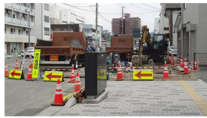
坂本製作所の跡地