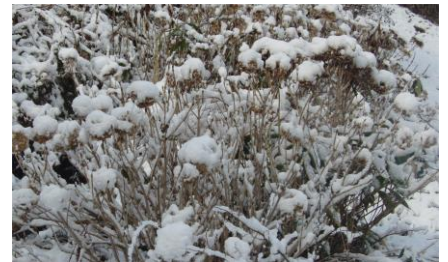
ドライフラワーのような紫陽花の上に雪