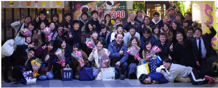
全員集合、これでお別れ？、いえいえ二次会へレッツゴー