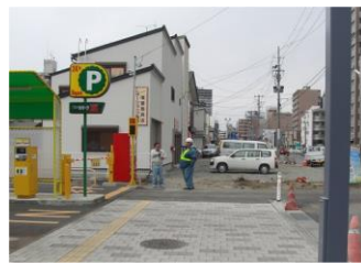
塩釜馬具店の跡地

大沢川原の再開発に反対して、立ち退きを拒否していた塩釜馬具店と坂本製作所が、いよいよ立ち退きに応じて旧店舗が解体されました。塩釜馬具店は奥に新築して新しい店になり、坂本製作所は引っ越しました。これにより、とどこうっていた道路の拡張工事が始まっています。全く無駄な税金をつかったものです。市街地の再開発は、自治体と住民のコンセンサスが大事で、それができないうちに工事着手などすれば、この大沢川原のようになってしまうのは目に見えていたはずです。なにはともあれ大沢川原の道路が完成するのを待ちましょう。出来上がった歩道の先は、砂利道で歩くにも一苦勞、拡幅が終わった車道は、車道制限のフェンスが並び、何をしたいのかもわからない状態です。これもあと少し、快適な道路になると思います。ノスタルジアが好きな長岡は、また盛岡の懐かしい町並みが消えてしまい、残念な気持ちの今日この頃です。