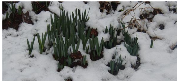
スイセンの目は凍えないようです。