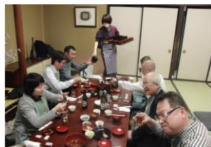
さあ、始まりました。

まずは、わんこそばの食事会です。盛岡3大麺の一つわんこ そばは300年の伝統を誇る盛岡の名物。一度は食べてみたい おそばです。お店は老舗の直利庵(ちよくりあん)テーブルに並 んだ薬味の美しさにまず感動。刻み海苔、ネギ、くるみ、お刺身 等と共に、一杯目のおそばが入ったお椀の登場です。開けてび っくり、「え、これだけ？」そうです、一口分しかおそばがありません。 わんこそばはお客様をおもてなしする究極接待のお食事な のです。給仕のお姉さま方が、掛け声と共にお椀のなかに次々 とおそばを入れてくれます。何杯も食べられる、そばをいっぱい 食べて貰おうと盛岡人が考えたそばの食べ方なのです。ちなみ に、全国わんこそば選手権が毎年開催され、優勝者は5分で30 0杯食べます。こちらは競技ですので、食べ方は下品です。私達 は落ち着いて美味しく頂きましょう。食べたお椀をどんどん重ね ていくお店もあります。ここ直利庵ではマッチ棒を使い食した数 を数えます。お姉さま型の掛け声に乗ってどんどん食べ進みま すが、気をつけなければならないのは、気が付けばお腹はパン パンに膨らみ、「だめ～もう食べられない」となります。ここから わんこそばの究極のご奉仕が始まります。食事終了のルール が有り、給仕のお姉さんが居る前で、最後の一杯を食べてから 次のそばを投入される前にお椀に蓋をしなければなりません。 お姉さんは手ぐすねをして待ち構えていますから蓋が間に合 いません、そばが投入されます。こうして普段食べたことのない量 のおそばを食べてしまいます。ちなみにこのお店では10杯で、 かけそば1杯の量になるとの事。盛岡人もお客様がこない限り は、なかなか行けない食事なのです。盛岡に来たときは、一度 お試しください。盛り上がりますよ。