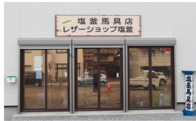
塩釜馬具店の新店舗

軽自動車が対抗出来ないほど狭かった大沢川原は2車線の車道と、広い歩道が整備されようとしています。この先には中津川があり。擬宝珠の下の橋があります。この道路をどこに繋ごうと