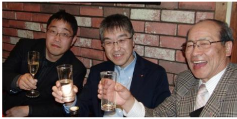
お酒美味しいね、大関さん。