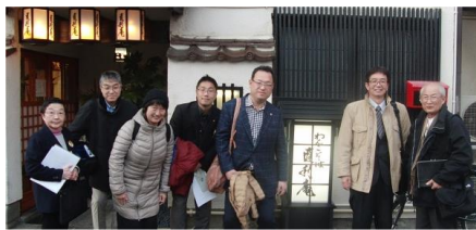
直利庵のお見せの前で

食事の後は、盛岡の夜景を楽しみ、お土産を買って、7時からの リーダー送別会に出席です。約2時間時間が経ち、お腹は少し は落ち着いたでしょうか？お酒は飲めますか？さあいきましょ う。