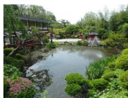
本殿横の庭園の池

新緑の枝と葉の間を吹き抜ける風、全身で爽やかさを受け止めて、もりおかかいうん神社の庭園を散策しました。もともと榊山稲荷神社として認識していましたが、もりおかかいうん神社と言うのが正式名称のようです。