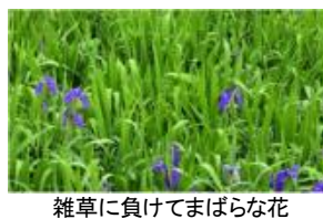
雑草に負けてまばらな花

盛岡市山岸の国道455号線沿いに県指定の天然記念物カキツバタの群落があります。ヨシなどの雑草が増えて、カキツバタの寝床を侵食。カキツバタがどんどん減っています。