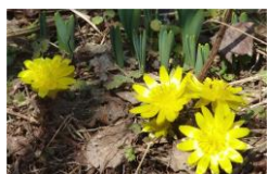
福寿草とスイセンの芽

3月8日、南岸低気圧が東北地方を襲いました。通常は湿った雪が降り積もるのですが、この低気圧は大雨を持ってきました。この雨により冬将軍が撤退していったのです。