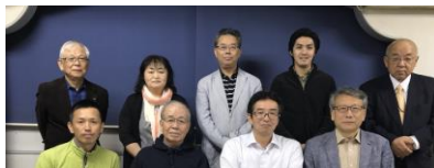
涌澤北東部部長の公式訪問