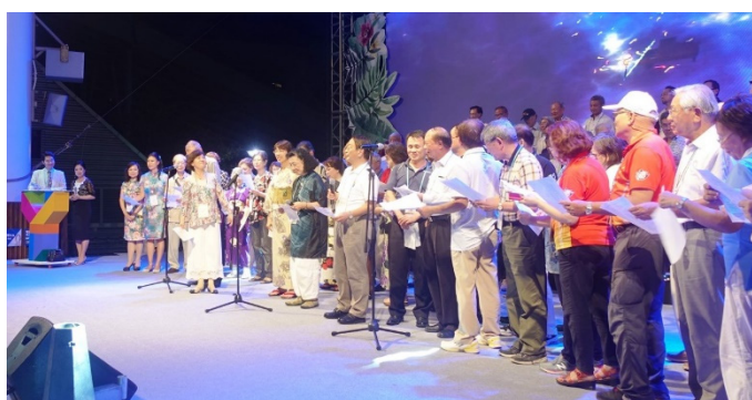
【We are the world】

3日目夜には各区による出し物があり、アジア太平洋地域は、地域からの参加者ほぼ全員が登壇し、「We are the world」を歌いました。