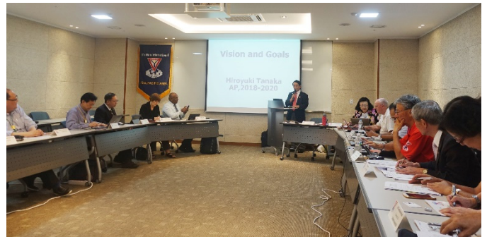
【アジア太平洋地域会長方針スピーチ】

8日午後には光陽でアジア太平洋地域議会を開催いたしました。地域内の区理事7名が議決権者で、国際議会同様に決算・予算の審議・承認、各区理事、地域事業主任の報告、各種議案の審議が行われました。