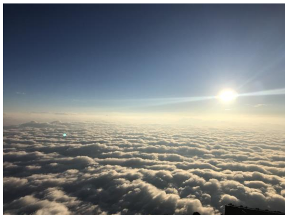
雲海が広がって・・・