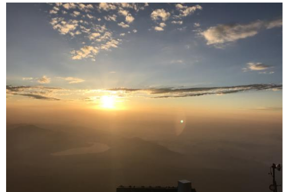
～富士山8合目から下界(すそ野)を望む