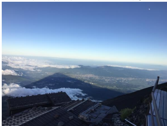
天気の良い日には富士山影富士がみえます

富士山で支配人をして40年。こんなに変化がある事は想像も出来ませんでした。今年全宿泊者の半分以上が外国人宿泊者になるという事は確実です。いったい富士山はどうか毎日下界を見て思う日々です。