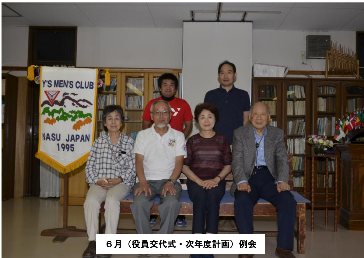
6月(役員交代式・次年度計画)例会

2018~2019年度 主題 国際会長：(IP) Moon Sang Bong (韓国) 「私たちは変えられる」 アジア地域会長：(AP) 田中 博之(東京多摩みなみ) 「ワイズ運動を尊重しよう」 東日本区理事：(RD) 宮内 友弥(東京武蔵多摩) 「為せば、成る」 北東部長：涌澤 博(仙台青葉城) 「チャンス到来 われら北東部から世界へ」