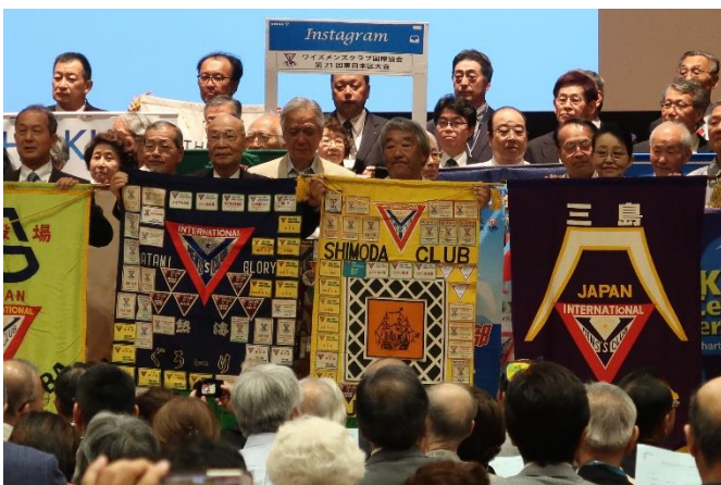
バナーセレモニー