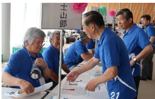
東日本区大会受付担当