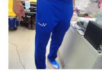
スタッフジャージ 下