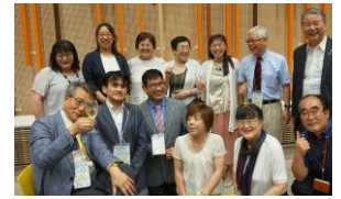
盛り上がった晩餐会