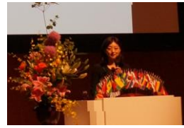
岩崎恭子氏記念講演↑

らずの笑顔と元気さで語られた。自分に正直であること、人と人のご縁を大切にすることなどを説き、聴衆を最後まで魅了してくれた。