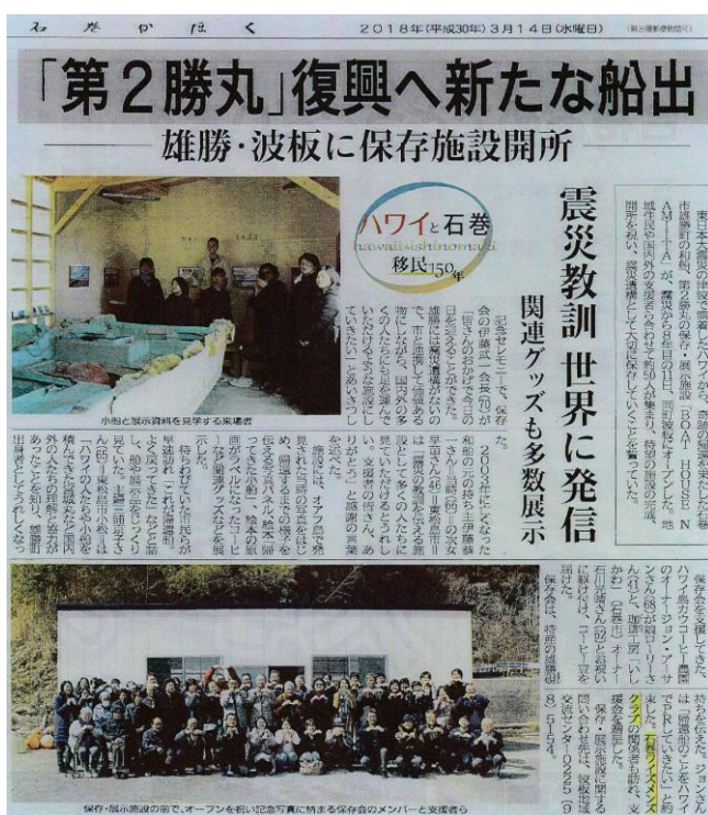
↓ 第2勝丸は下の波板海岸よりハワイに漂着した