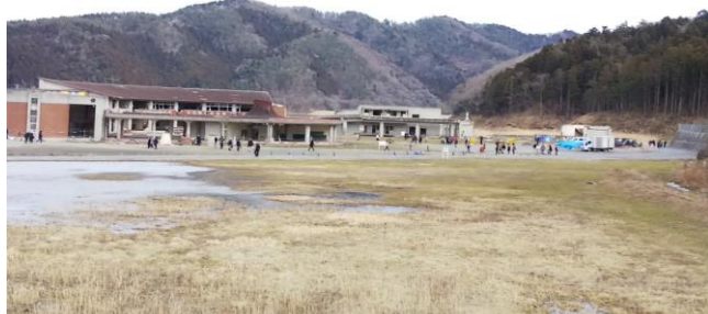
↑ 生徒74名、先生10名が犠牲になった大川小学校、かつての家並みはなく更地には水溜りが広がり、一日中追悼者が絶えませんでした。