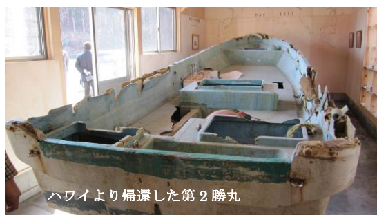
ハワイより帰還した第2勝丸