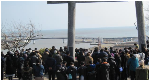
↑ 3月11日午後2時46分、日和山公園は大勢の市民で埋め尽くされサイレンの合図で祈りの時がもたれました。

●各地で追悼の祈りがもたれる（7年前、石巻市全市で3, 278名の方が犠牲になりました）