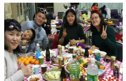
留学生と海外のご家族