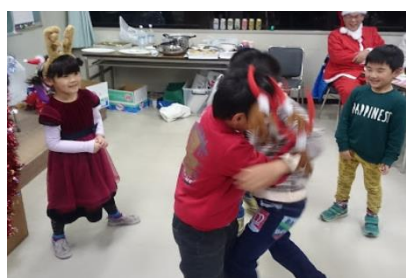
モンゴルの子供たちとモンゴル相撲!