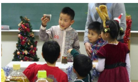
子供たちのマジックに拍手喝采!