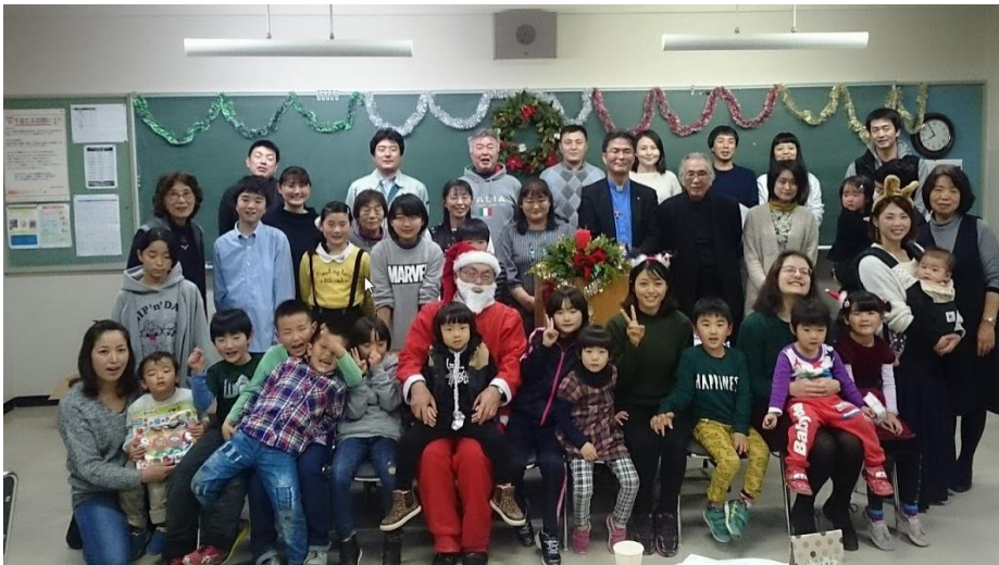
青葉城クラブには子供たちがたくさん! 楽しいクリスマス例会でした!