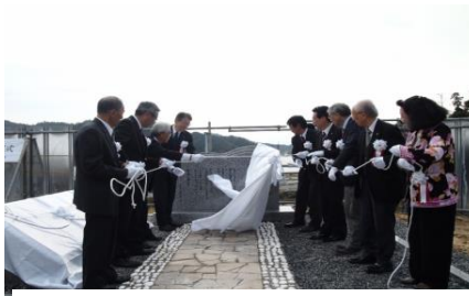
来賓・プロジェクト代表者による除幕