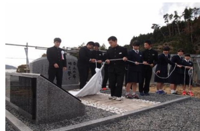
生徒全員による除幕