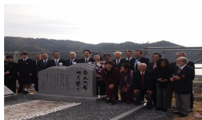
YMCA・ワイズ関係出席者↑