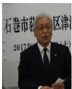
←石巻市副市長 菅原秀幸氏

内容：開式のことば、目録贈呈、来賓あいさつ、感謝状贈呈、建立の概要説明、感謝の集い、懇談、お祝いのメッセージ、閉会のあいさつ