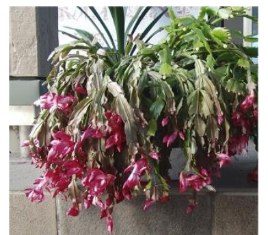
かにサボテンの花