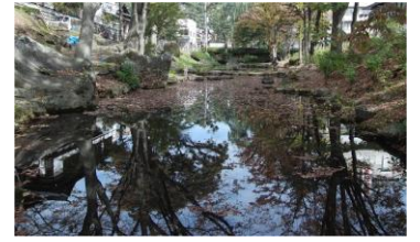
鶴ヶ池に移った青空