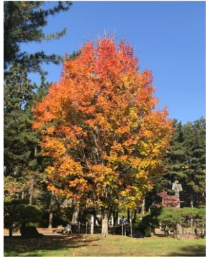
メイプル、カナダのもみじ

公園内には、桜山神社があります。裏には名勝烏帽子岩があります。盛岡城築城時に突出した大石がでてきました。城内の祖神さまの神域でしたので、宝大石とされ以後、吉兆のシンボルとして広く信仰されました。災害や疫病などがあつたとき、この石の前で平安祈願の神事が行われ、南部藩盛岡の「お守り神」として今日まで崇拝されています。