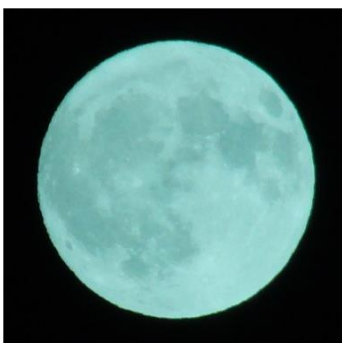
ほぼ、満月。中秋の名月

盛岡のリンゴはおいしいですよ。生産量日本一は青森、スピード出荷では長野、岩手は三番目です。東北各地はそれぞれリンゴの名産地がありますから、ファンとしてはなかなか大変です。ですから、本当においしいリンゴを販売しています。