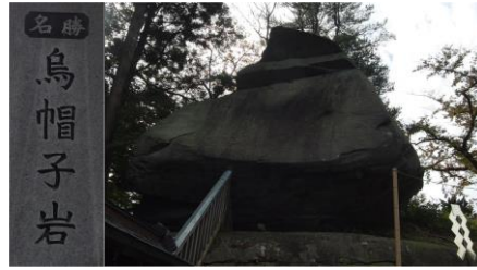
桜山神社の烏帽子岩、裏から見ると落ちそうで怖い。