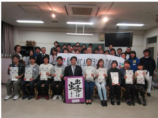
【前列は社会へ巣立つユースボランティア ～出逢いは宝～を胸に】