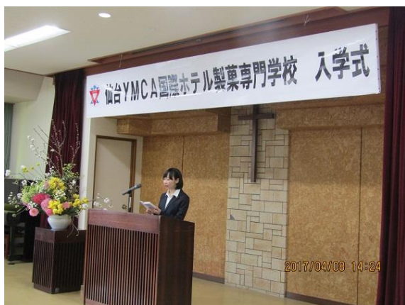
【仙台YMCA国際ホテル・製菓専門学校入学式】