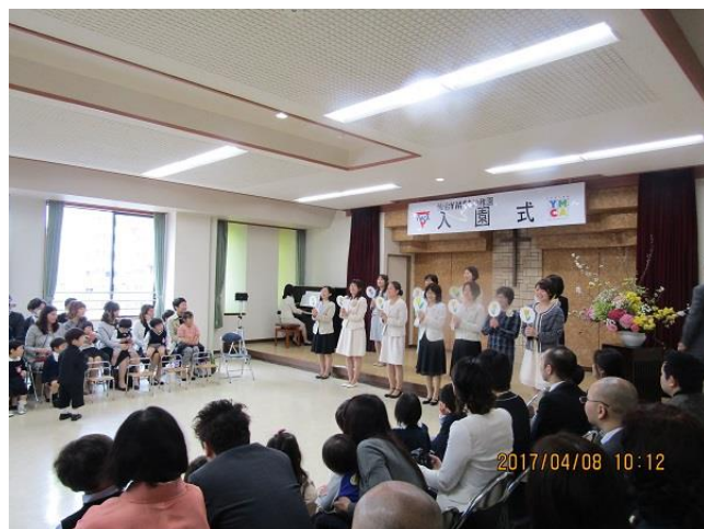
【仙台YMCA幼稚園入園式】

4月8日(土) 仙台YMCAは賑やかな一日でした 認定こども園・仙台YMCA幼稚園入園式 仙台YMCA国際ホテル・製菓専門学校入学式 が行われました。出会いの4月に多くの園児さん、専門 学校生をお迎え出来たことに、喜びを感じています。仙 台YMCA特別活動、バザー、チャリティーラン、クリ スマスなどで一緒にできる事を楽しみにしています