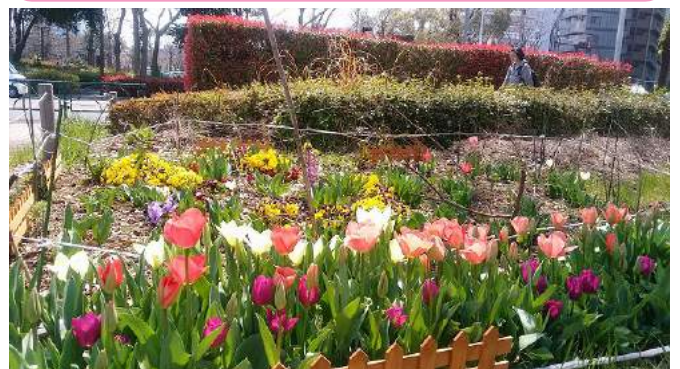
安藤メネットによるチューリップが満開です (4月5日撮影)