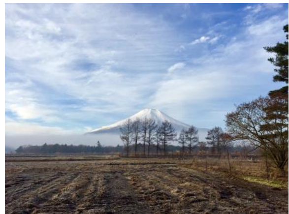
山中湖花の都公園にて

会員数 11名 例会出席 10名 例会出席率 91% ニコニコBOX 0円 累計 486円