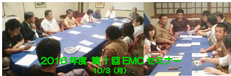
2016年度 第1回 EMCセミナー 10/3(月)