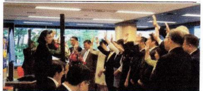
手を挙げて入会を宣誓する 新クラブの新会員たち

新しいクラブが、一人ひとりのワイズメンやメネットにとって多くの学びと交流の場となり、その豊かな交わりに力を得て、YMCAへの支援が行われ、さらには地域の青少年の全人的な育成という働きが良き実を結ぶことを、心より願っております。