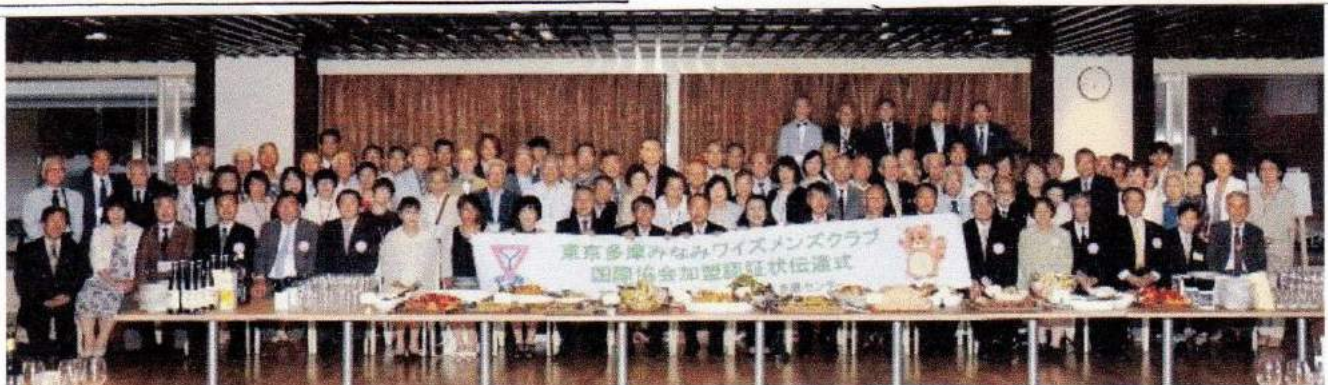
<チャーターナイト>に参列した101名の参加者たち(全国各地から)