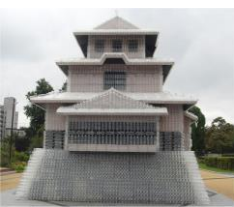
なんともみずぼらしい

ペットボトルで作った盛岡城が出現、夜の美しさに対して昼のなんじやこれ、というギャップがすごい。岩手国体の記念事業で行ったそう