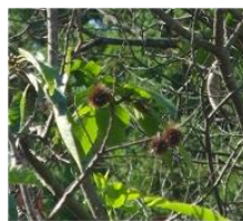
枯れてしまった栗

昨年の大きな栗の葉が枯れてしまった事件が、今年は息子の記念樹の丹波栗に起こった。もう一本はなんとか持ちこたえているが、なんか怪しいぞ。