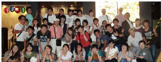
お疲れ様でした、大成功

せん。約2時間半、最後までハイテンションは続きました。しかし、わが大関さんの締めセレモニーが始まると一気に大関さんに集中しました。このけじめのつけ方、お行事の良さがただの若者と違うYMCAのリーダーです。5分にも及ぶ大関さんの締めセレモニーに集中して付き合うリーダーたちでした。なんとかかわいいリーダーたちでしょう。ワイズのおじさんはますます君たちの事が大好きになった夜でした。