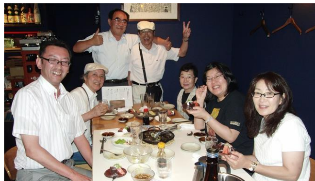
大関さん今宵も絶好調、みなさんいい顔ですね。