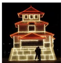
ロナンチックな影

8月は、真夏の気候から始まり、お盆までは夏、その後は秋風が吹きだし実りの秋に移っていくのですが、なんかへんだよね。そんな盛岡をご紹介します。まずは、台風の影響です。続けて2つ東北地方をおそいました。いきなり北日本へ襲来はほとんど経験がありませんでした。そしていま、訳のわからない動きの10号が迫っています。お気をつけください。