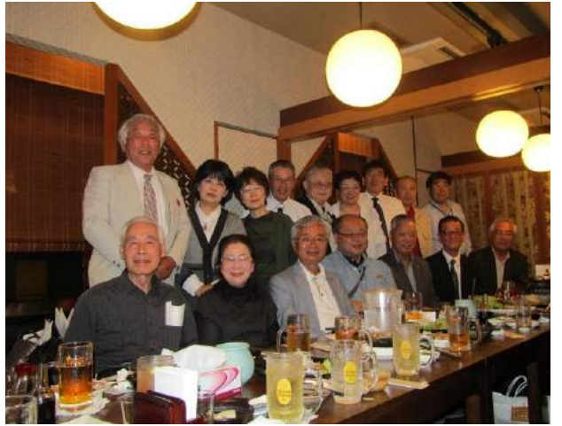
金沢クラブとの交流会

翌日は、仙台YMCAにおいていただき、施設見学と活動報告をお聞きいただき、夕刻に金沢に帰られた。