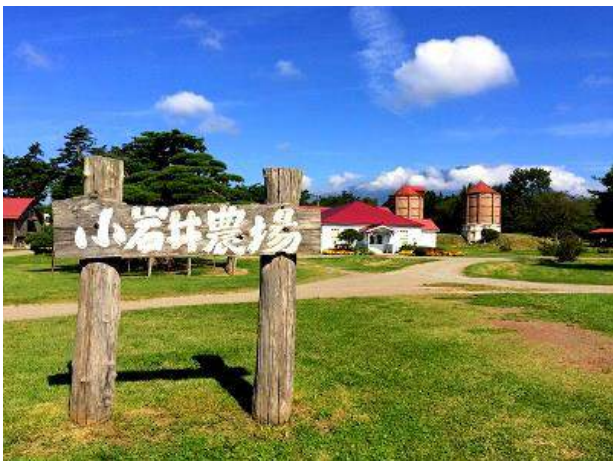
写真は直利庵 Facebook、小岩井農場ホームページより

最終日7月3日 遠くへ行く元気もなくバスで小岩井農場まきば園に行く。7月の普段日観光客は少なくゆったりしていた。園内バスツアー小岩井農場めぐりに乗り小岩井農場の広さを実感した。3,000ヘクタール(山手線内側の面積ほぼ半分)を生産農場として、農林畜産をベースにした事業を展開しているとの事。列举すれば酪農事業、乳加工・販売事業、種鶏事業、たまご事業、山林事業、観光事業・・・バスツアーは小岩井農場の歴史とその足跡を辿るツアーでした。チーズを土産にバスで盛岡へ。15時30分はやぶさ24号で帰途に、石和温泉20時04分到着、早々と我が家に帰り着きました。