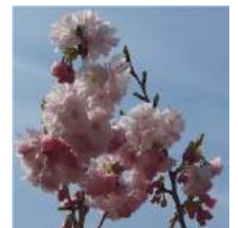
八重さくらのアップ