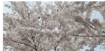
大好き、二高のソメイヨシノ

暖かった冬も終わり、盛岡にも順調に春がやってきました。いつまでも寒い日が続き、一気に春がやってくる年は、花という花が同時に咲き出すという現象はよくありました。今年は、ぬるぬると暖かく冬将軍も逆襲できないままに退散しました。あれ？なんで今年も一気に花が咲きだすの？こぶし、梅、すいせん、石割桜、ソメイヨシノ、ゆきやなぎ、八重さくら、まあこんな感じでリリースしてさくのですが、一気に同時に咲き出しました。冬が弱くてもこんな現象が起きるのですね。