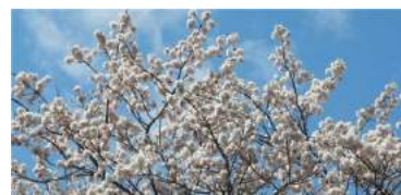
だんごのように、枝に盛り上がる