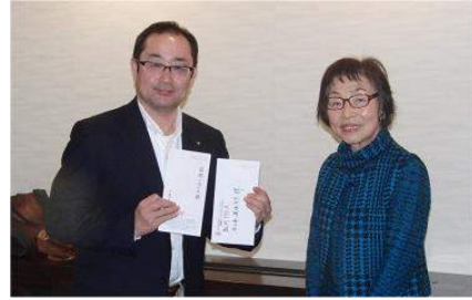
頂きました、ありがとうございます。

活動と行動にこころより感謝申し上げます。最終日も盛岡市内を散策予定でしたが、さすがにお疲れのご様子で、盛岡市内の散策は中止になりました。