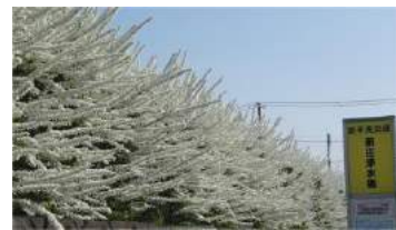
バス停の横、ゆきやなぎが咲き誇る