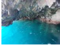
青の洞くつの色です。

ハウスで津波の映像を上映してもらい、津波の怖さや悲惨さを再認識。三陸ラーメンを食した後は、南三陸のリアス海岸を一路南下、半島の峠を越えて、入り江の海の繰り返しで大槌町へ、悲惨な被害の象徴旧大槌町役場前で、犠牲者にお祈りしました。震災遺構として残