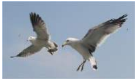
人に慣れてるウミネコ

その後、浄土が浜へ移動、さっぱ船に乗って浄土が浜周辺をクルーズ。ウミネコの襲来を受けながら海洞「青の洞くつ」へ突入、なんとも言えない色は不思議な空間を体験。観光地の浄土が浜のほんの先なのにここにはウニやアワビ、岩蠣などが見えるのです。きれいな海と、資源の豊かさを実感しました。レスト