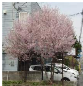
綿あめのような山桜