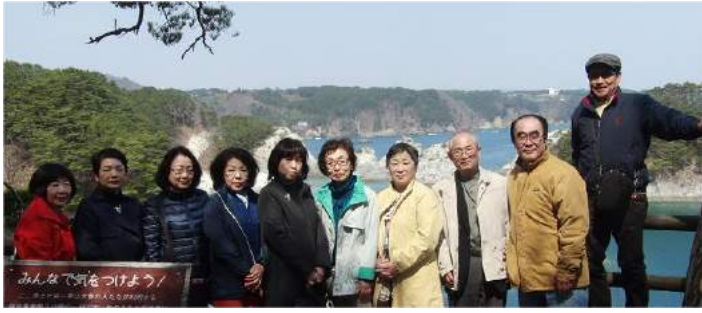
浄土が浜をバックに、展望台より。

その後、浄土が浜へ移動、さっぱ船に乗って浄土が浜周辺をクルーズ。ウミネコの襲来を受けながら海洞「青の洞くつ」へ突入、なんとも言えない色は不思議な空間を体験。観光地の浄土が浜のほんの先なのにここにはウニやアワビ、岩蠣などが見えるのです。きれいな海と、資源の豊かさを実感しました。レスト