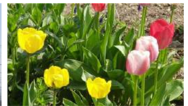
チューリップも咲きました