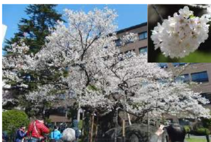
ご存じ石割桜、可憐な白色