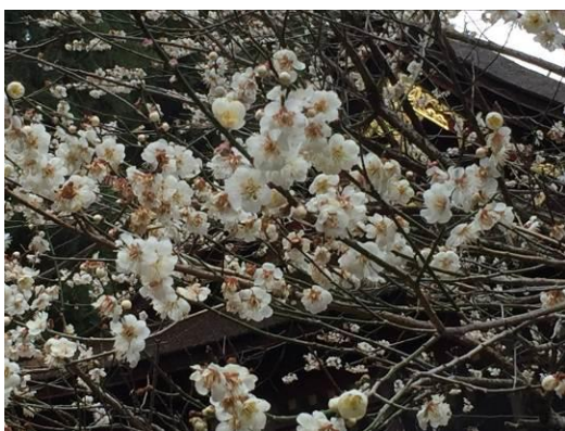
北口本宮富士浅間神社の夫婦うめ