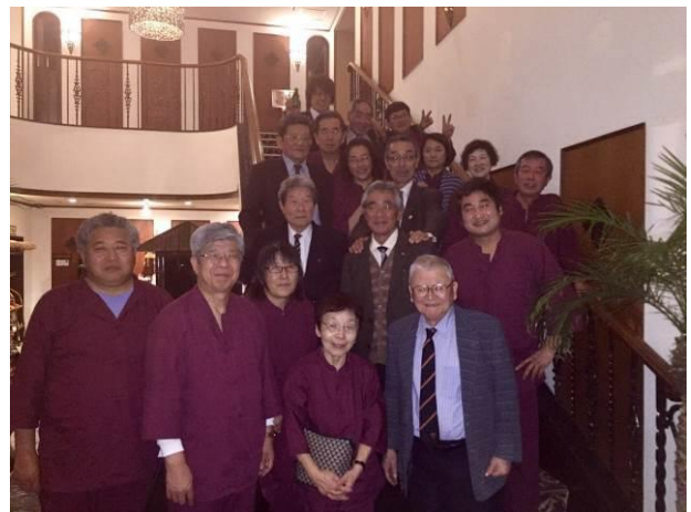
集合写真をパチッ!!

翌日はまっすぐに大室山に向かい、全員リフトから転げずに降りられたので無事山頂へ。残念ながら伊豆七島は見えなかったものの、深い火口底やそこから噴き出た溶岩で出来た広々とした伊豆高原の風景を楽しみました。伊豆シャボテン公園はあまりに長い入場者の列を見て諦め、伊豆ガラスと工芸の美術館でガラスとは思えないガラス製品に驚き、ジャポニズムなるものを学びました。この日のお昼は蕎麦屋で由比の桜海老のかき揚げを楽しみ、拳骨饅頭のお店と伊豆高原駅の干物のお店でお土産を買い入れてお楽しみは終了。私は駅駐車場でフライングデスク大会までのしばしのお別れをしました。