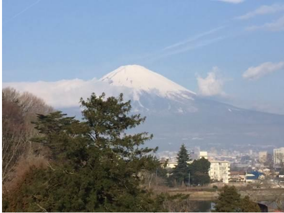
東山荘からの富士山

とでした。役員が毎年同じ人になってしまう傾向か、研修会に参加されない方も多いうように思いますが、次期理事の方針にのっとってみんながまとまり会が運営されていくと思うので研修会にはもっと多くの方が参加してほしいと思いました。