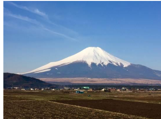
～忍野から富士を望む