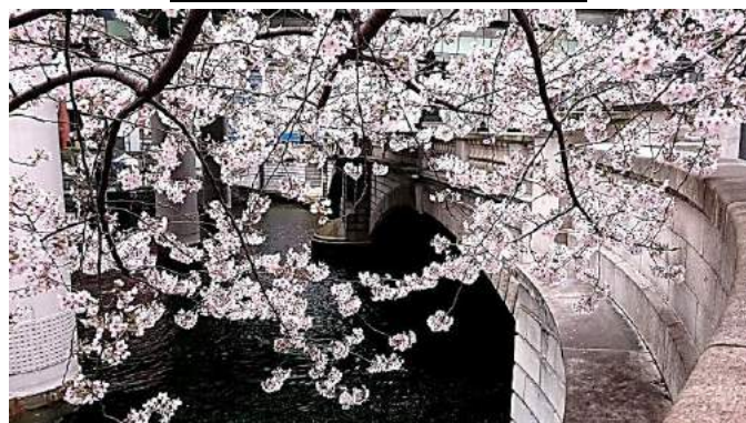
日本橋に咲くサクラ

毎年、毎年、サクラは変わらずに咲いてくれます。 この季節、3月に東日本区では次期クラブ会長・部役員 研修会が催され、4月、5月には各部の評議会に於いて、 同様に次期クラブ役員の研修会が行われます。 より一層のクラブ、部の活性化を期待したいです。 ワイズメンの4つの「アイ」を思い出しましょう。 Idealism 理想を持つこと、 Interest 興味を持つこと、 Initiative 率先して、 Industry 労をいとわぬこと。