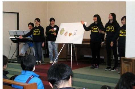
パネル・シアター「コンコンクシャン」

習を重ねたパネル・シアターによる「はらぺこあおむし」と「コンコンクシャン」が披露されました。客席の子どもたちが食い入るように見つめたり、楽しそうに身体を動かして一緒にダンスをしたりという光景がみられ、ステージと会場が一体となった素晴らしいコンサートでした。