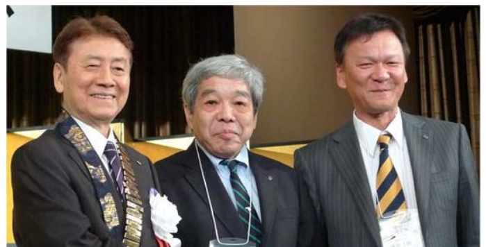
西宮クラブ様、宮古の支援ありがとうございます。おめでとうございます。

表彰も独創性に富み(例:青年会員獲得賞、近い将来青年会員獲得の予感賞など)また、西宮クラブは東日本復興支援への働きでCS最優秀賞を受賞、岩国みなみクラブは優秀ブリテン賞を金沢、宝塚クラブと共に理事表彰を受けました。