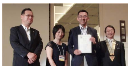
ステージ上で記念撮影

晩餐会の前に厚木中学校による吹奏楽の演奏がありました。30名を越える演奏があり、生演奏を堪能させてもらいました。19時からはお楽しみ晩餐会です。今回の出席者は430名との事で、知っている方も多くおり近況報告、東日本大震災の援助のお礼をお話して回りあつという間の楽しい時間でした。