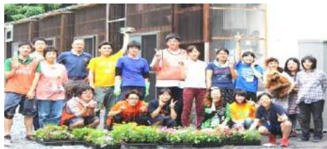
— 昨年のツアーから —

3月に湘南とつかYMCAで行われた「東日本大震災復興支援チャリティイベント」で集った募金の一部から、7月10日(金)