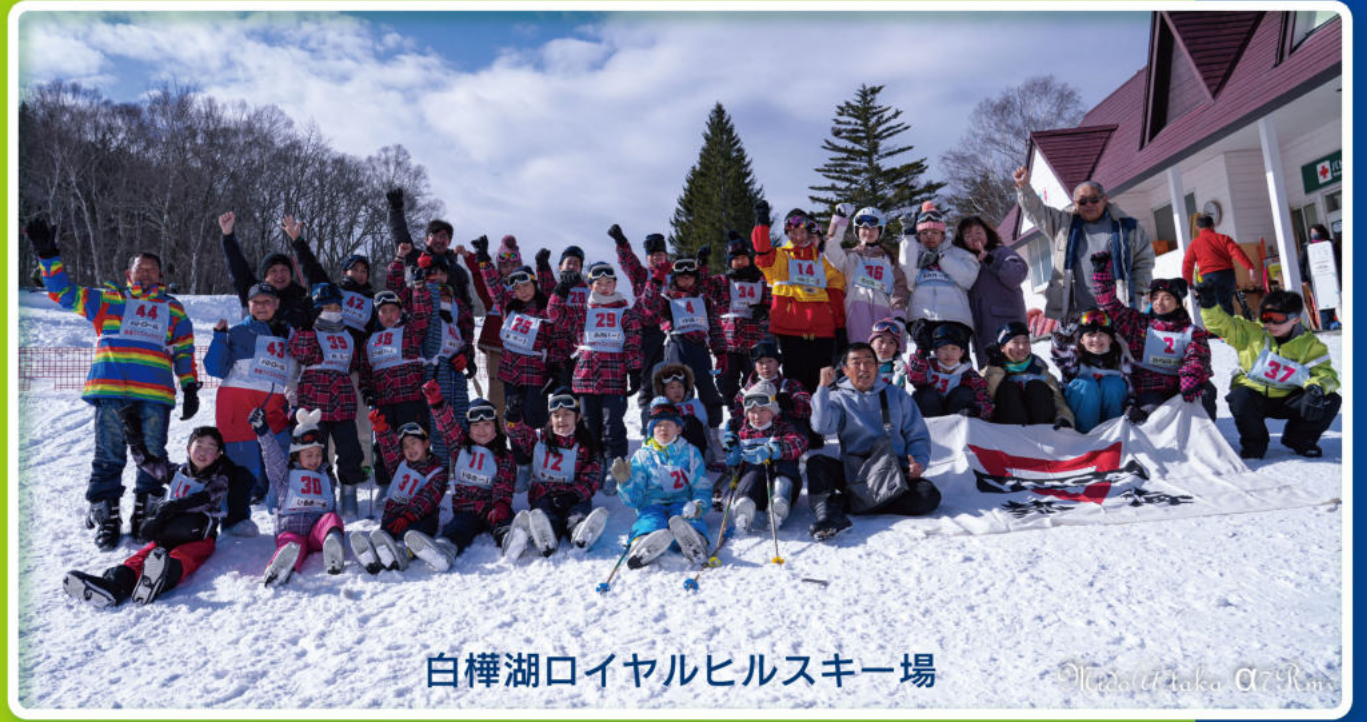
白樺湖ロイヤルヒルスキー場

TO ACKNOWLEDGE THE DUTY THAT ACCOMPANIES EVERY RIGHT