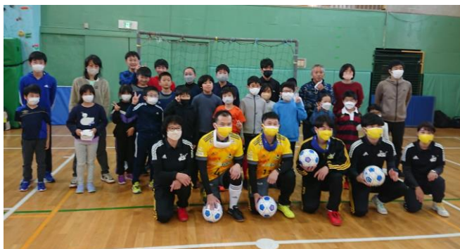
上: 「なまーら北海道」の皆さんと記念撮影