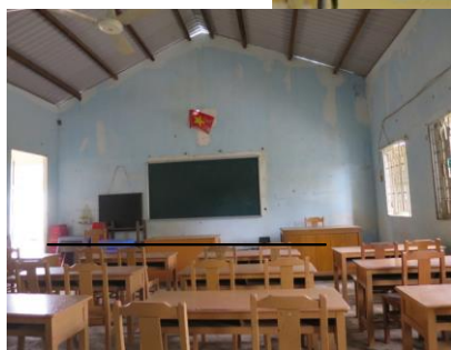
写真左： 真新しい机と椅子が子供たちを待っています。

2022 年のボランティアワークは、日本からベトナムへの渡航が引き続き難しかったため、中止となり、YMCA より小学校建設に必要な費用 9,200 ドルを送って建設事業は行いました。2022 年は Phong Nam 小学校が対象で、5 月に工事がスタート、9 月に完工式が開催されました。建設された小学校では、現在 5 年生の児童が授業を受けています。