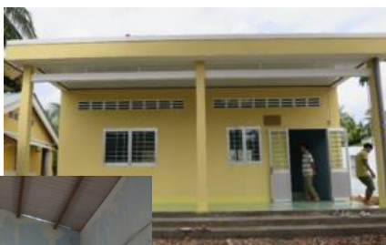
写真上： 新装なった校舎