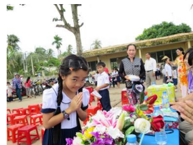
写真上： 校舎落成式にお花を持ってお礼に訪れた少女。上目遣いが愛らしい。

これからも北海道 YMCA と連携して、ベトナムの人たち、子供たちが安全で充実した人生を送れるようにサポートしていきたいと考えています。