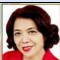
物品事業主任 チュラ 南東アジア区