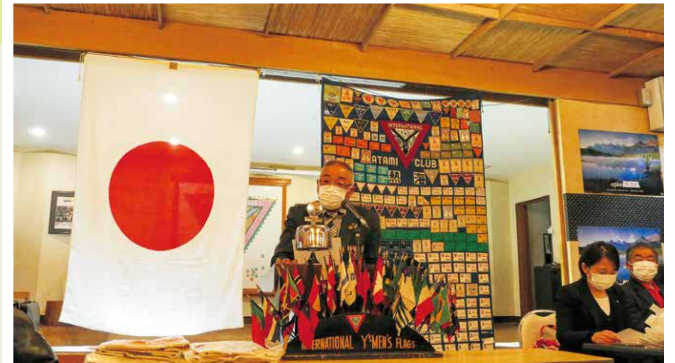
熱海クラブ会長主題

TO ACKNOWLEDGE THE DUTY THAT ACCOMPANIES EVERY RIGHT