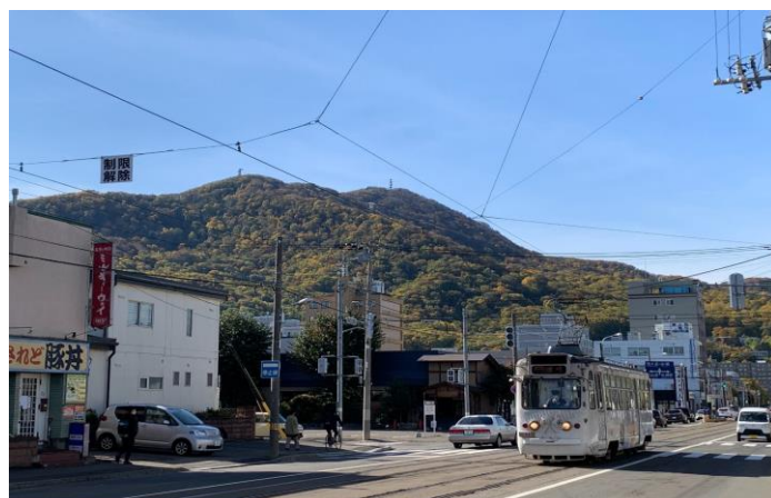
診療所は風光明媚、閑静な藻岩山の麓にあります。

私自身もこのような「家庭医療／総合診療」が地域に根付き、地域の方々が安心して生活できるよう地道に貢献していきたいと思っています。