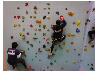
ウオーリングクライミング