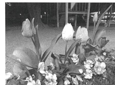
【童謡】 チューリップより