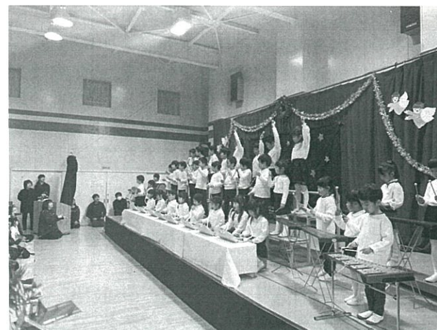
合奏「きらきら星」「ドレミの歌」の様子

2019年もお支えいただきまして誠にありがとうございました。本年もどうぞよろしくお願いいたします。YMCAに繋がるすべての人の健康が守られますように、そして神さまの豊かな祝福と恵みが与えられますようにお祈りします。