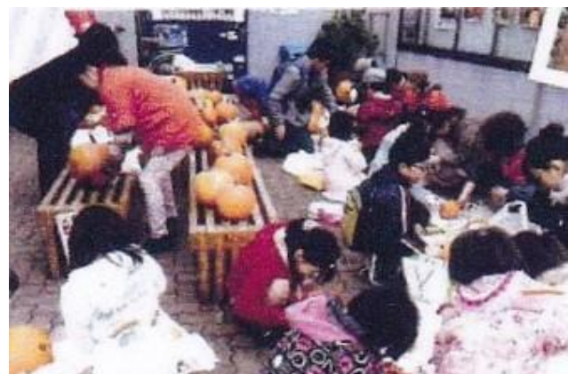
写真上: 「ハロウween」のかぼちゃのラン タン作りに励む行啓通りの子供たち。ハロウween と冬の氷の雪灯は行啓通りの名物行事です。