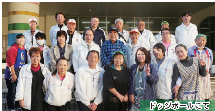
ドッグボールにて