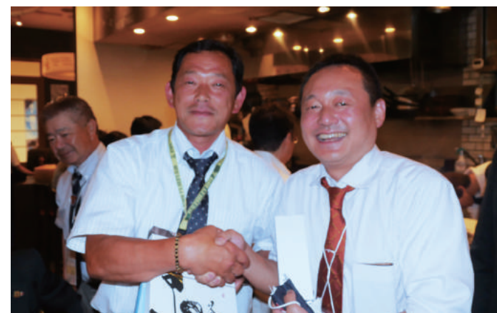
京都パレスとのフェローシップ