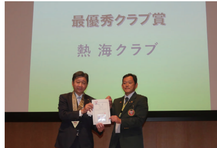
最優秀クラブ賞 獲得！