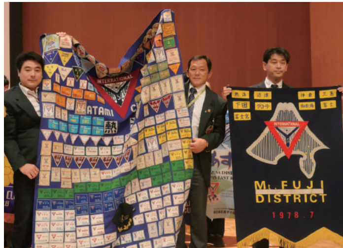
バナーセレモニーにて