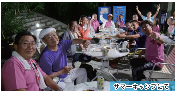
サマーキャンプにて