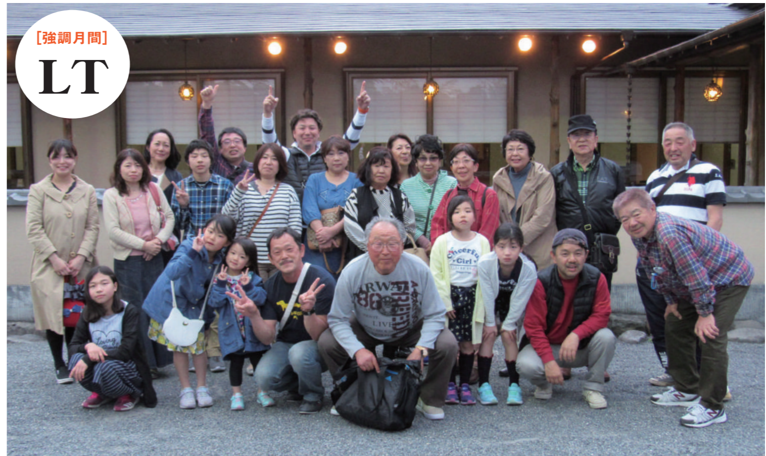
【今月の聖句】 そのとき、イエスは彼らに言われた「恐れることはない。行って兄弟たちに、ガリラヤに行け、そこでわたしに会えるであろう、と告げなさい」。(マタイによる福音書(ふくいんしょ) 第28章10節)