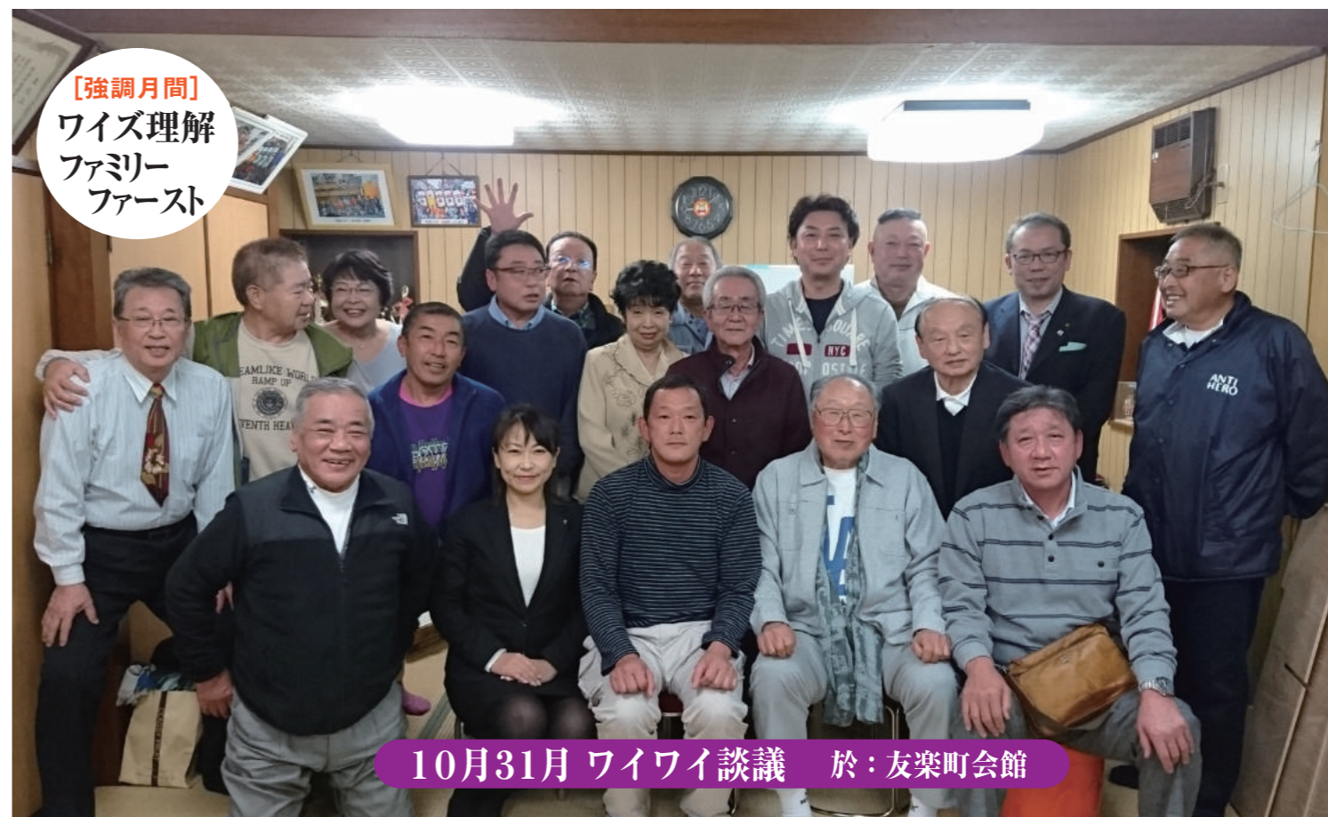
10月31日 ワイワイ談議 於: 友楽町会館

【今月の聖句】 心に知恵ある人は聡明な人と呼ばれる。 やさしく語る唇は説得力を増す。見識ある人はその見識が命の泉となる。(箴言(しんげん) 第16章21節)