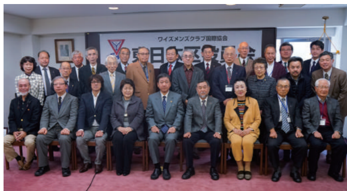
11月4日 東日本区役員会 開催 於:日本YMCA同盟会館